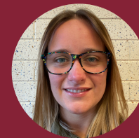
السيدة سي ماكناتن قائد أول لحماية الطفل وصونه. المعلم المعين بالمدرسة