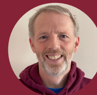
السيد دي لاني نائب المدير للمناهج. وكيل المدرسة المعين